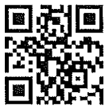
แบบฟอร์มคัดกรองสำหรับนิสิต

7. นิสิตที่เดินทางมาจากพื้นที่ควบคุมสูงสุดและเข้มงวด (พื้นที่สีแดงเข้ม) และพื้นที่ควบคุมสูงสุด (พื้นที่สีแดง) ต้องแจ้งรายชื่อ และสแกนคิวอาร์โค้ดของมหาวิทยาลัย ประสานเจ้าหน้าที่คณะหรือศูนย์ประสานงานฯ เพื่อเข้ารับการวินิจฉัย และ/หรือตรวจหาเชื้อที่โรงพยาบาลสุทธาเวช