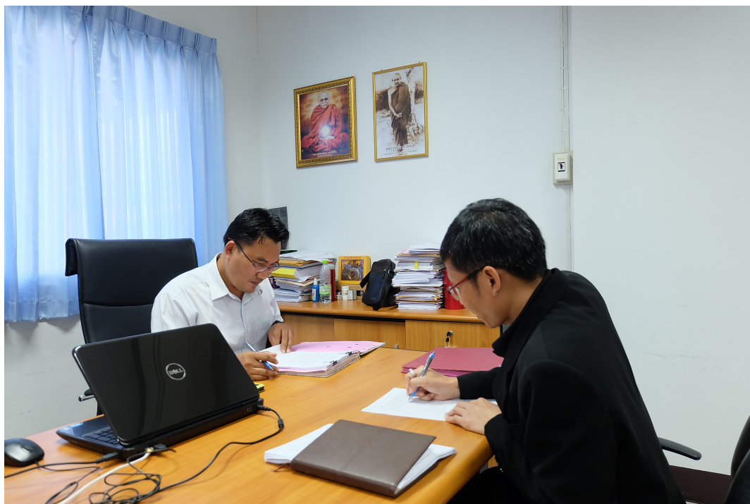
ภาพประกอบ 13 สัมภาษณ์ผู้ช่วยอธิการบดีฝ่ายวิจัย มหาวิทยาลัยมหาสารคาม