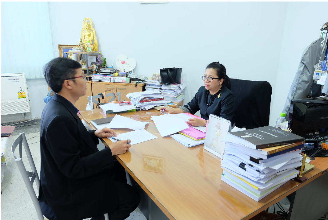
ภาพประกอบ 20 สัมภาษณ์ผู้อำนวยการกองแผนงาน มหาวิทยาลัยมหาสารคาม