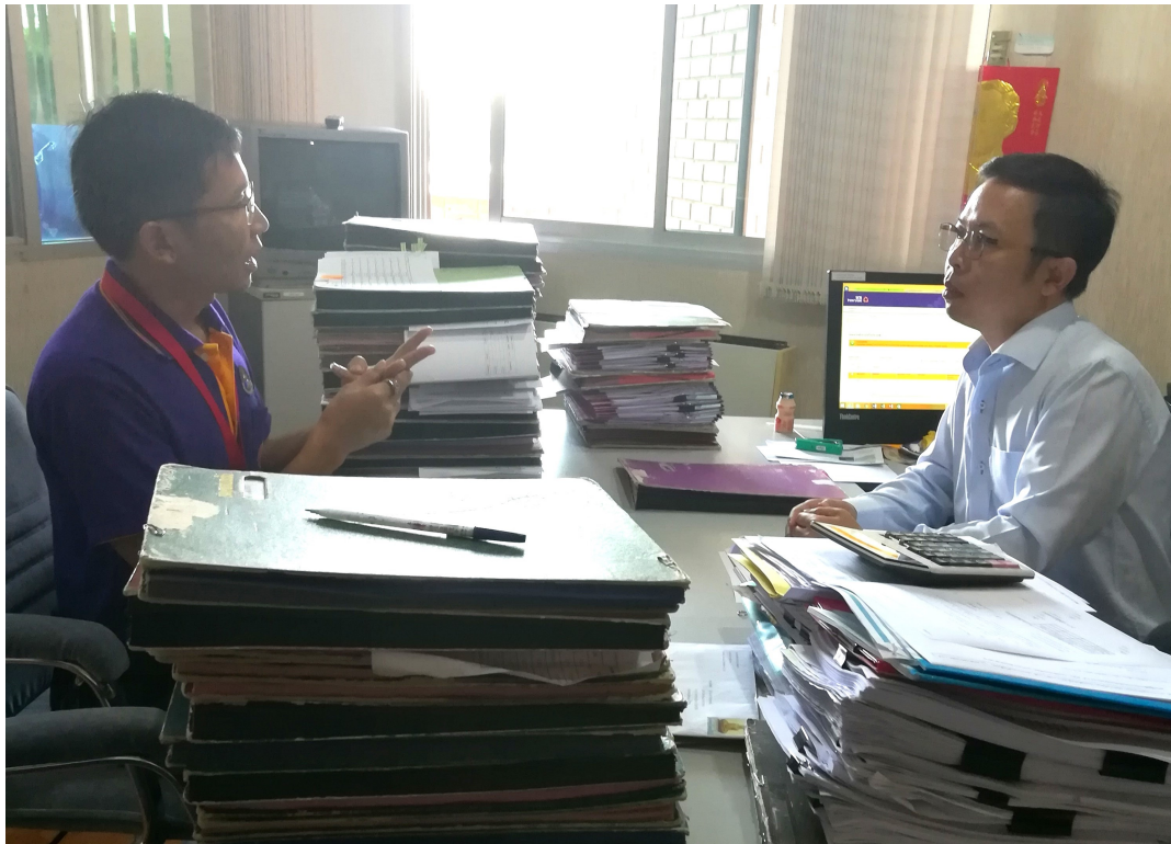
ภาพประกอบ 21 สัมภาษณ์ผู้อำนวยการกองคลังและพัสดุ มหาวิทยาลัยมหาสารคาม