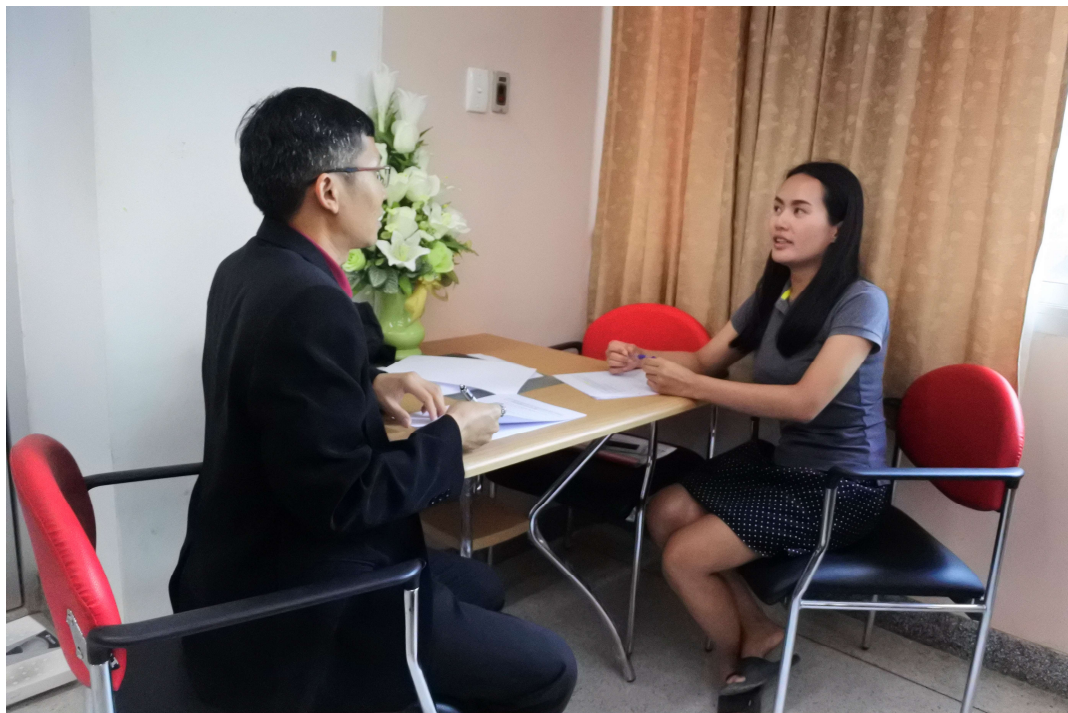
ภาพประกอบ 5 สัมภาษณ์เจ้าหน้าที่มหาวิทยาลัยมหาสารคาม กลุ่มปฏิบัติการ