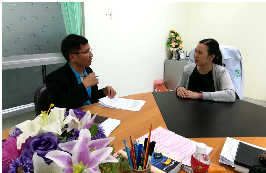
ภาพประกอบ 17 สัมภาษณ์คณบดีคณะเกษตรศาสตร์ มหาวิทยาลัยมหาสารคาม