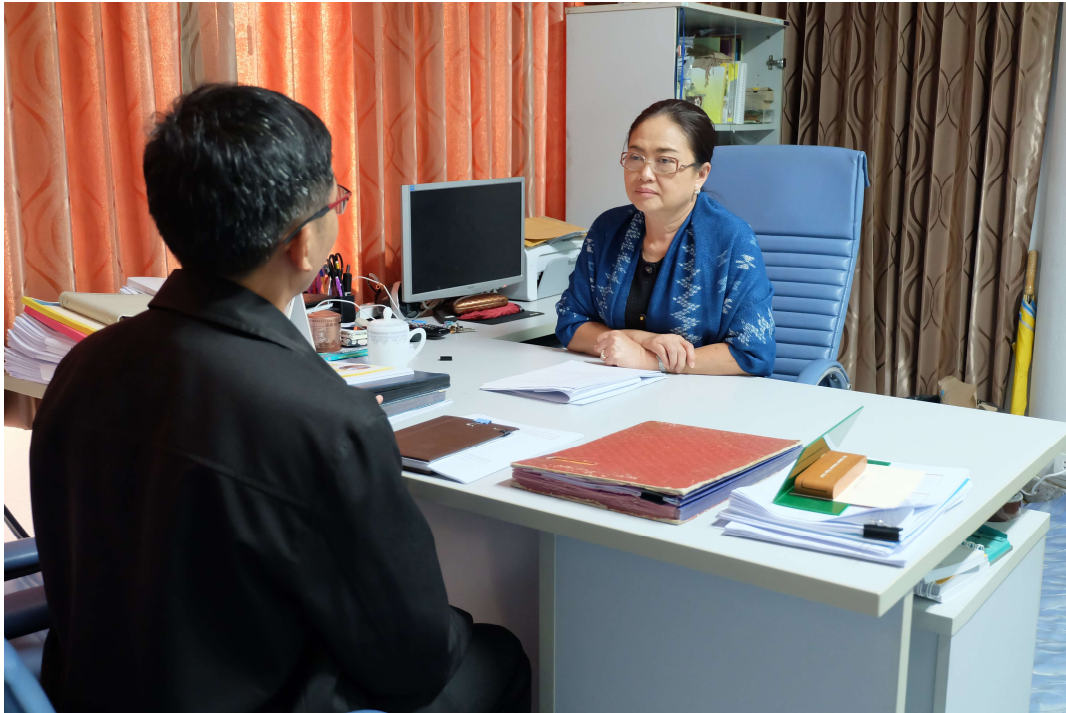
ภาพประกอบ 19 สัมภาษณ์ผู้อำนวยการกองบริการการศึกษา มหาวิทยาลัยมหาสารคาม