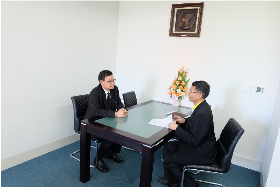
ภาพประกอบ 15 สัมภาษณ์คณบดีคณะศึกษาศาสตร์ มหาวิทยาลัยมหาสารคาม