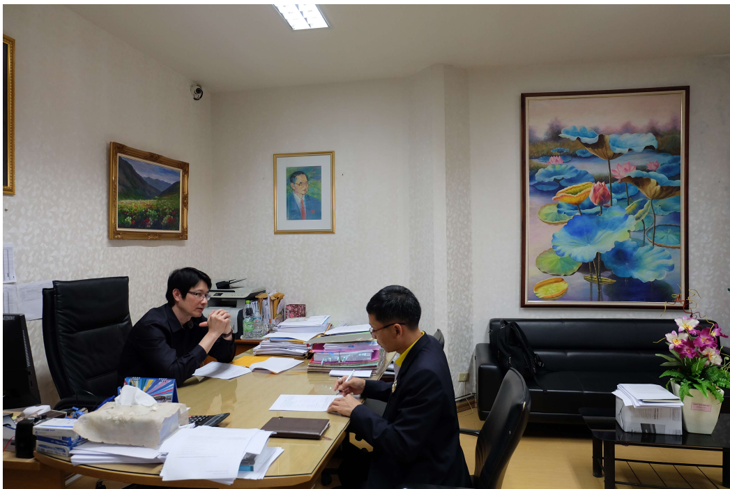
ภาพประกอบ 10 สัมภาษณ์รองอธิการบดีฝ่ายอำนวยการ มหาวิทยาลัยมหาสารคาม