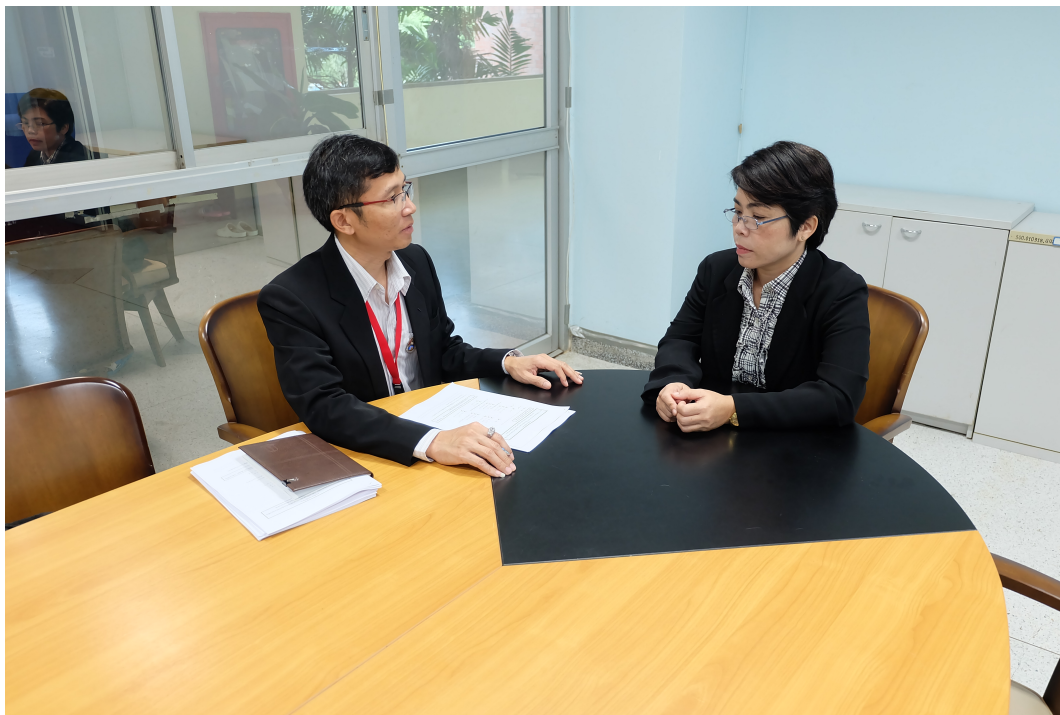
ภาพประกอบ 6 สัมภาษณ์เจ้าหน้าที่มหาวิทยาลัยมหาสารคาม กลุ่มผู้บริหารระดับกลาง (1)