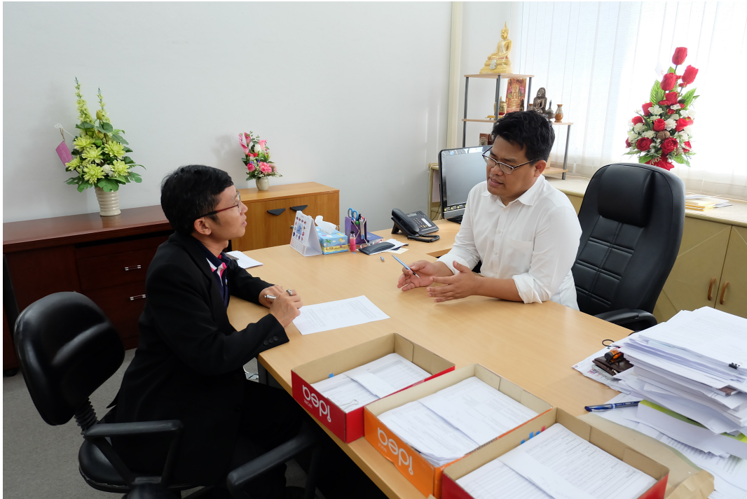
ภาพประกอบ 11 สัมภาษณ์รองอธิการบดีฝ่ายวางแผนและกิจการพิเศษ มหาวิทยาลัยมหาสารคาม