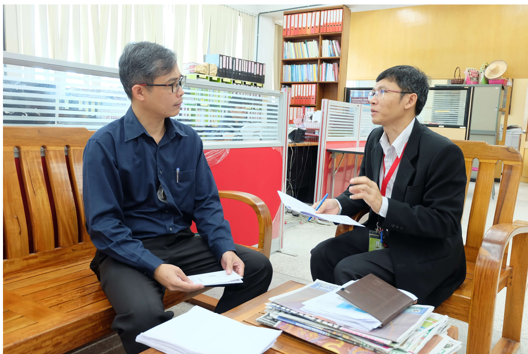
ภาพประกอบ 14 สัมภาษณ์ผู้ช่วยอธิการบดีฝ่ายอาคารและสถานที่ มหาวิทยาลัยมหาสารคาม