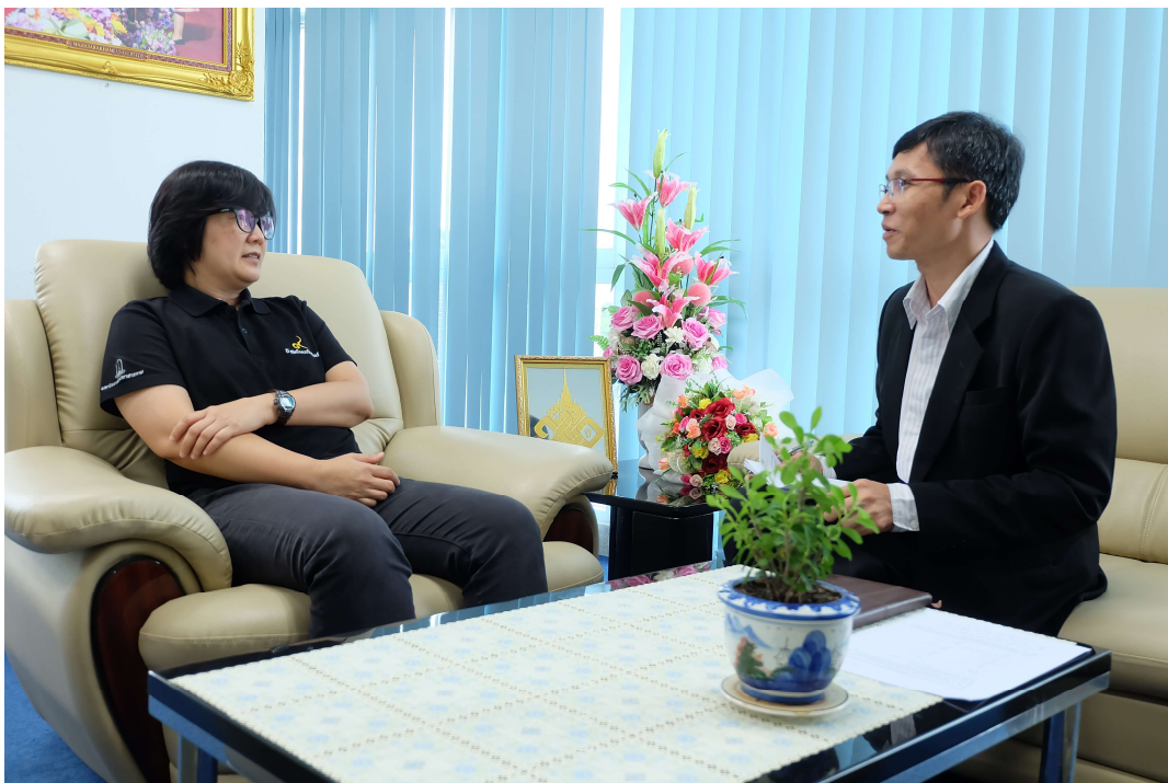
ภาพประกอบ 12 สัมภาษณ์รองอธิการบดีฝ่ายพัฒนานิสิต มหาวิทยาลัยมหาสารคาม