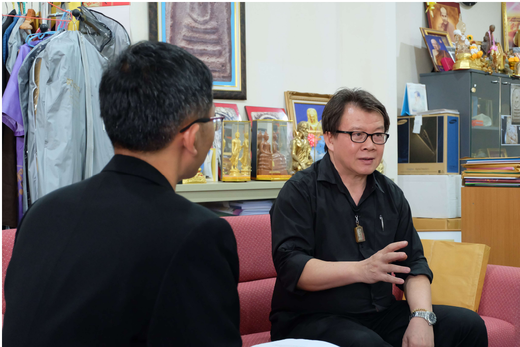
ภาพประกอบ 9 สัมภาษณ์รองอธิการบดีฝ่ายวิชาการ มหาวิทยาลัยมหาสารคาม