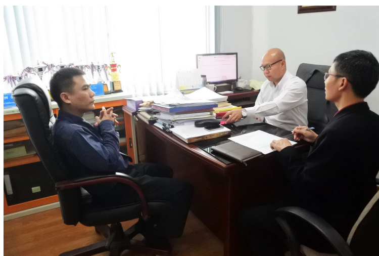
ภาพประกอบ 8 สัมภาษณ์อาจารย์ มหาวิทยาลัยมหาสารคาม