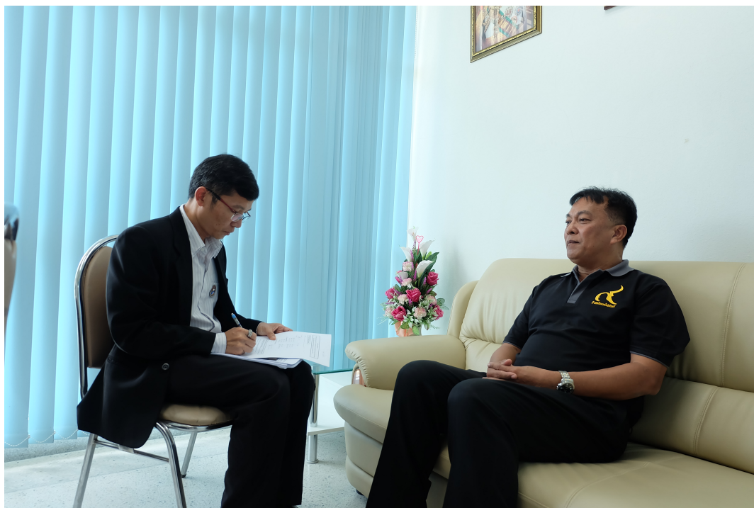
ภาพประกอบ 18 สัมภาษณ์ผู้อำนวยการกองกิจการนิสิต มหาวิทยาลัยมหาสารคาม