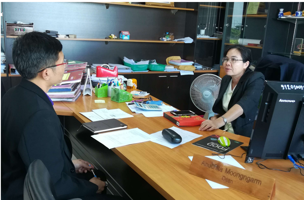
ภาพประกอบ 16 สัมภาษณ์คณบดีคณะเทคโนโลยี มหาวิทยาลัยมหาสารคาม