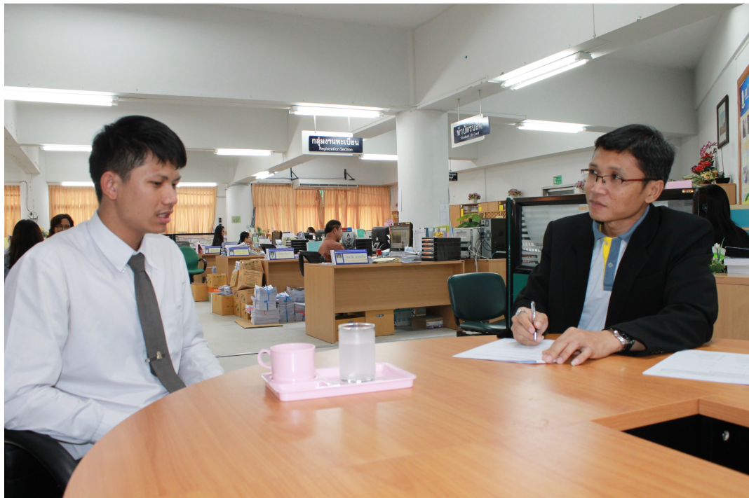
ภาพประกอบ 4 สัมภาษณ์นายกองค์การนิสิตและประธานสภานิสิตมหาวิทยาลัยมหาสารคาม