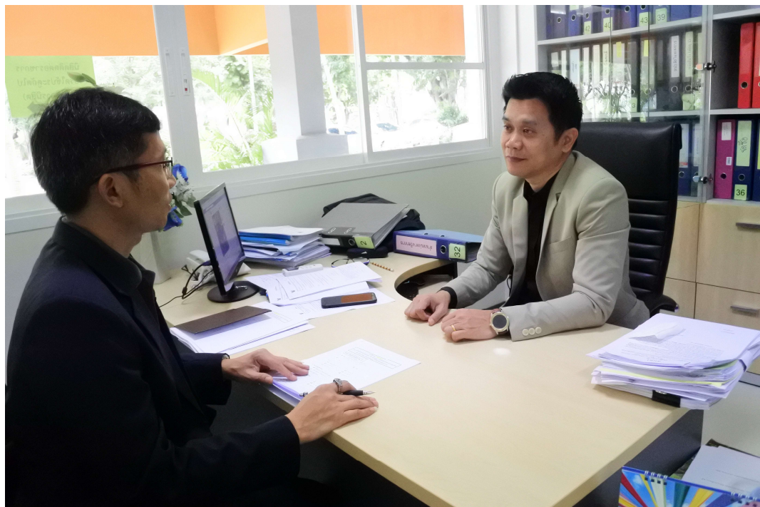
ภาพประกอบ 7 สัมภาษณ์เจ้าหน้าที่มหาวิทยาลัยมหาสารคาม กลุ่มผู้บริหารระดับกลาง (2)